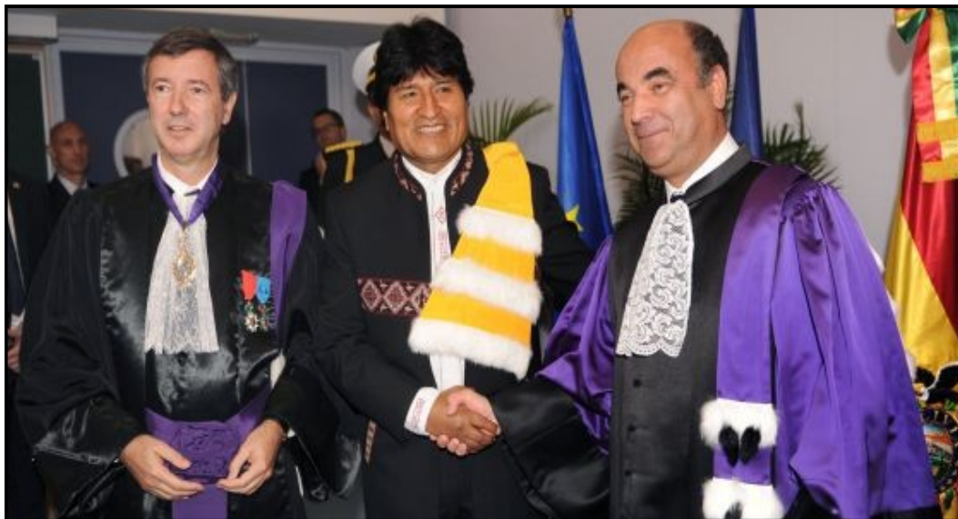
Evo Morales, en el centro, tras recibir el 'Honoris Causa' de la Universidad de Pau.

El presidente de Bolivia, nombrado Doctor Honoris Causa, destaca que su mérito es convertir a políticos en servidores del pueblo y no de sus intereses.