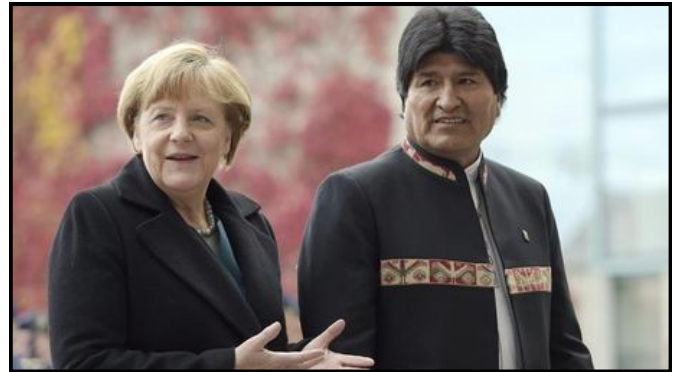
L'hôte a mis en exergue le programme politique de Morales

solaire, la gestion de l'eau pour l'agriculture et l'utilisation du lithium. « La Bolivie veut investir dans l'énergie éolienne et nous avons décidé d'améliorer la coopération sur ce point », a précisé la chef du gouvernement allemand. Les leaders ont également fait savoir que l'Allemagne enverrait des experts juridiques pour contribuer à l'amélioration