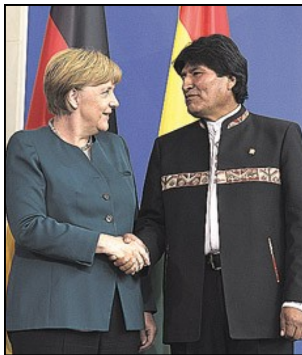
La anfitriona destacó la agenda política de Morales.

Por la tarde fue recibido por el presidente federal alemán Joachim Gauck, visitó la sede del Parlamento alemán y se reunió con representantes de la principal formación opositora de Alemania, el Partido La Izquierda, con el cual el Movimiento al Socialismo de Morales mantiene una cooperación. El jefe de Estado boliviano cerró la jornada con un discurso que despertó ovaciones de unos 2000 estudiantes en el aula magna de la Universidad Técnica de Berlín. Allí defendió su objetivo de buscar una nueva reelección.